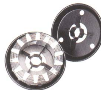
Катушка проволоки Innershield весом 6,3 кг (14 lbs) со специальным адаптером - вид упаковки, применяемой для работы с LN-23P

Для работы с LN-23P необходим специальный адаптер K350 (или K350-1). С помощью этого адаптера так же возможно подключение двух LN-23P к одному источнику питания. Если два LN-23P коммутируются через адаптер - они могут быть установлены на различные режимы, однако работать они будут поочередно. В качестве источника питания возможно использование всего спектра сварочных аппаратов Lincoln Electric, имеющих жесткую вольтамперную характеристику. Для работы в трассовых условиях рекомендуется использование автономного агрегата Commander 500 , тиристорного трансформатора-выпрямителя Idealarc DC-400 или универсального инверторного источника питания марки Invertec V350-PRO , питаемых от автономной электростанции.