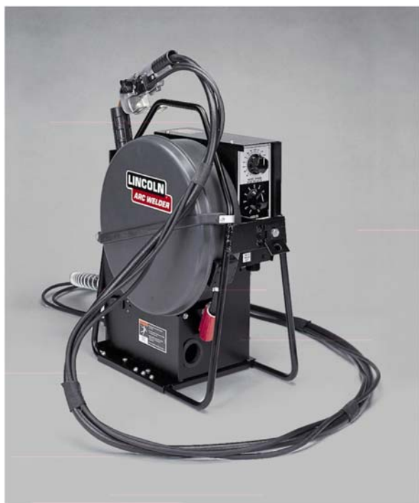
LN-23P с горелкой K345-10

Механизм подачи LN-23P предназначен и оптимизирован для полуавтоматической сварки стыков трубопроводов порошковой проволокой диаметром от .068" (1,7 мм) до 5/64" (2,0 мм) от источников постоянного сварочного тока с жесткой внешней характеристикой. Имеет специальное "трассовое" исполнение, отличающееся дополнительной защитой электрических схем от влаги и повышенной прочностью корпуса.