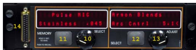
Панель специальных процессов